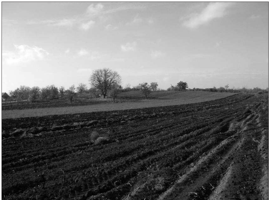
Слика 1 – Локалитет Манастириште – Мајдан, са истока

Манастир се налази на благо заталасаној греди, односно на заобљеном узвишењу које се на истоку и северу благо спушта ка