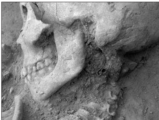
Слика 6 – S карика са некрополе