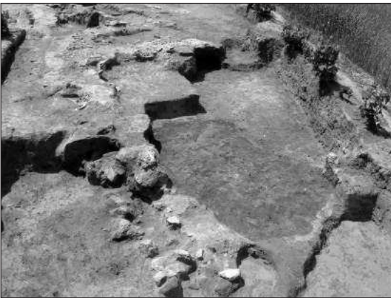
Слика 4 – Готичка црква, са југоистока