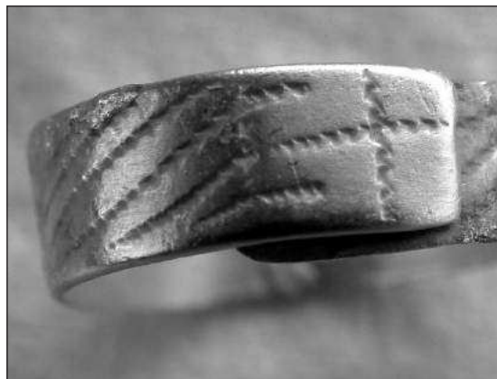
Слика 7 – Прстен са некрополе

Истовремено је истраживана и некропола. На основу до сада откривена 282 гроба, може да се закључи да је некропола формирана у XI веку. У гробовима су