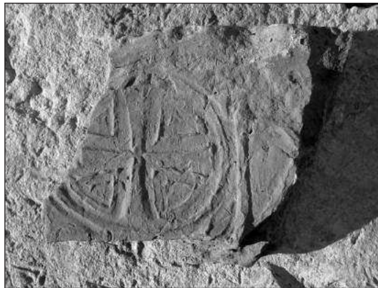
Слика 5 – Опека са уписаним крстом