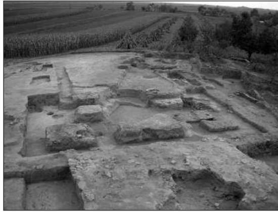
Слика 3 – Звоници романичке цркве, са запада