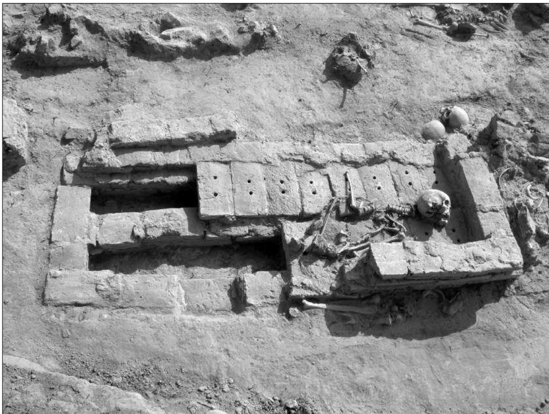
Слика 8 – Гробница на некрополи

Ископавање некрополе ће бити настављено у наредној кампањи.